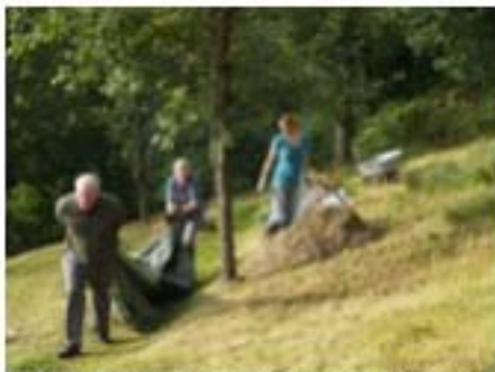
La MNSH participe au fauchage tardif d'une pelouse calcaire en cours de restauration sur la rive gauche

La Maison de la Nature et des Sciences y poursuit un objectif d'améliorer nos connaissances sur le réseau écologique local. Les données concernant la faune et la flore observées durant nos activités sont intégrées ensuite dans une banque de données en cours d'élaboration.