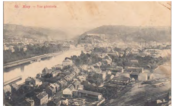
2013 : la chaussée de Waremmes et ses vues remarquables sur le centre ville historique de Huy sera notre ligne de mire

C'est pourquoi la Fédération inter-environnement Wallonie a proposé la mise en place d'un Observatoire citoyen du paysage dans notre région. Basé sur la prise en compte, via des prises de vues photographiques régulières, des évolutions affectant nos paysages, il a pour objectif de nous aider à mieux percevoir les changements, positifs ou négatifs, qui marquent notre environnement et nous donner ainsi des moyens de réagir.