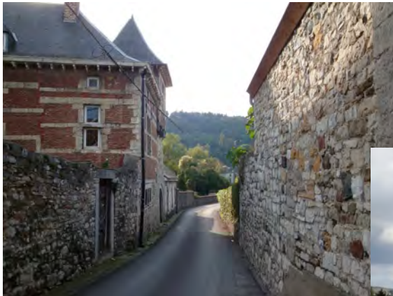
2011 : le quartier Saint-Hilaire / Saint-Victor inaugure ces promenades paysagères

Si nous n'ignorons pas l'importance des grands paysages, souvent touristiques, dans ce qui compose notre patrimoine régional, les paysages de notre quotidien passent plus souvent inaperçus : parce que sans doute nous les voyons tous les jours et ne percevons parfois plus vraiment leurs qualités.