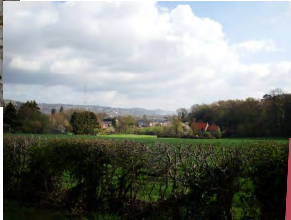
2012 : le village de la Neuville est choisi pour son authenticité et son caractère presque rural aux portes de Huy

Depuis une quarantaine d'années, l'urbanisation «galopante», les conséquences d'une toujours plus grande mobilité, les enjeux énergétiques, ont