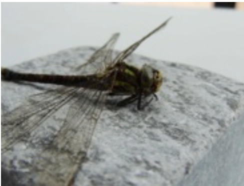
Les libellules (Odonates) serviront probablement de test pour les premiers encodages grandeur nature !

L'une, Lise, s'intéresse à la ville sans pesticide, c'est-à-dire à la manière d'entretenir les espaces publics de manière non polluante et non nocive. Elle se penche plus particulièrement sur la gestion du cimetière de la Buisnière afin d'envisager quels moyens permettraient de réaliser cet objectif dans le court terme. Nous vous dirons dans un prochain numéro les conclusions de ses recherches.