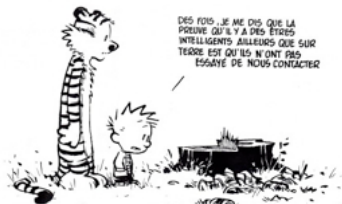
Calvin & Hobbes de Bill Watterson, 1990

Merci de mentionner les prénoms des personnes adhérentes.