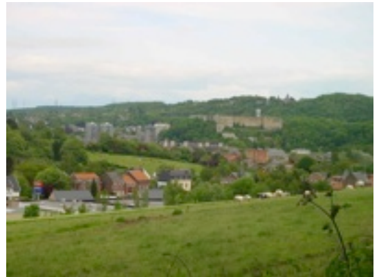
Les paysages et leur évolution rentreront plus tard aussi dans cette démarche.